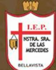
I.E.P. Nuestra Sra. de las Mercedes - Bellavista