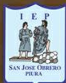
I.E.P. San José Obrero - Piura